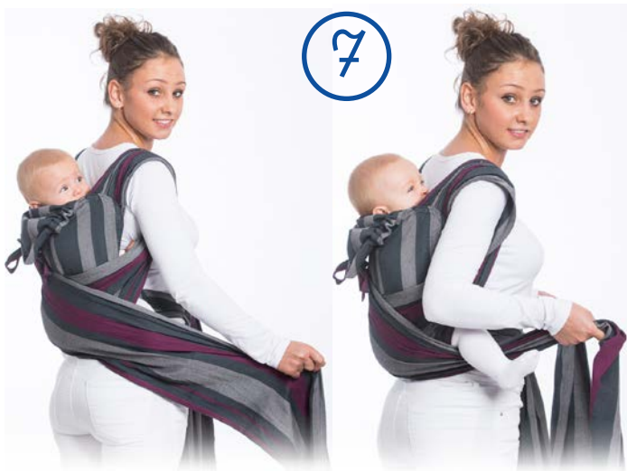
Przełóż w ten sam sposób drugi pas ramienny. Follow the same steps for the other shoulder strap.