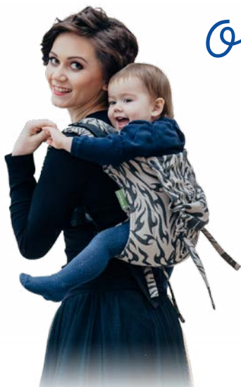
Nosidełka Onbuhimo Onbuhimo carriers