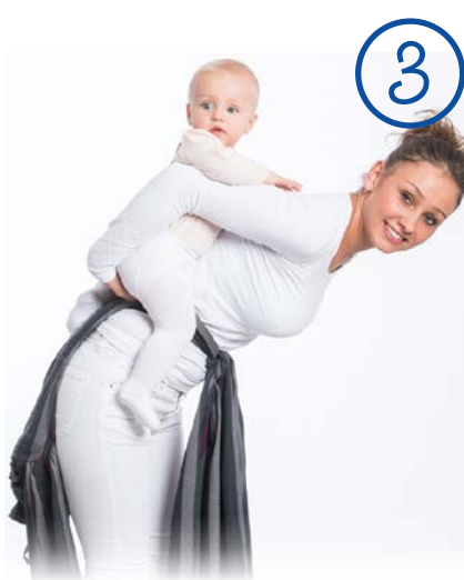
Powoli zdejmij panel z pleców dziecka. Przesuń dziecko do przodu przez biodro. Slowly take the panel off the baby's back. Slide the baby over your hip to the front.