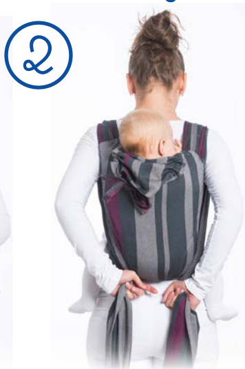
Cały czas trzymając oba pasy, wyjmij je spod nóg dziecka. While holding both straps take them from under the baby's legs.