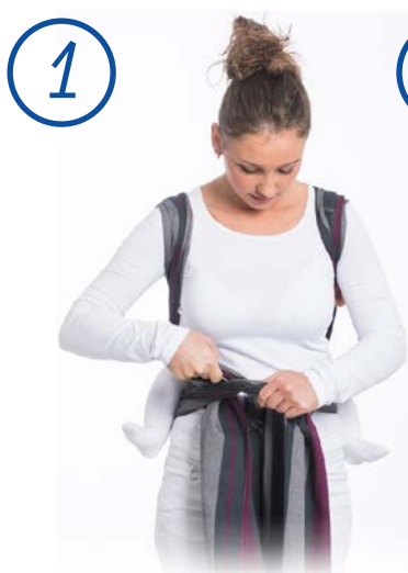
Pochyl się delikatnie do przodu i rozwiąż pasy ramienne. Lean forward gently and untie the shoulder straps.

Aby wyjąć dziecko z nosidła / To take the baby out of the carrier