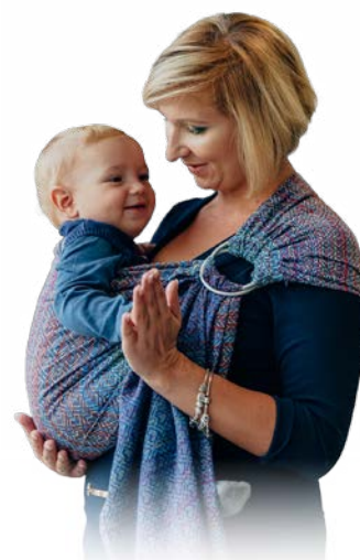
Chusty kółkowe Ring slings