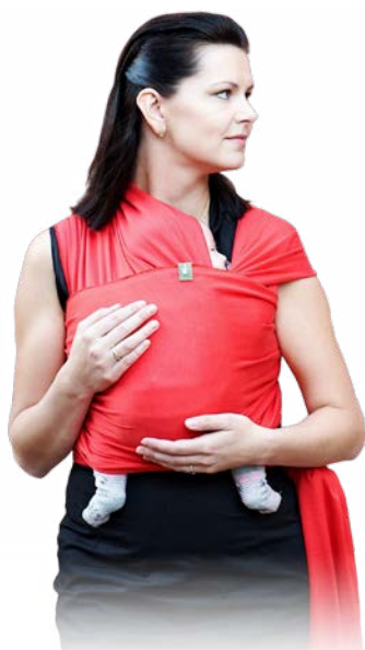
Chusty elastyczne Stretchy wraps