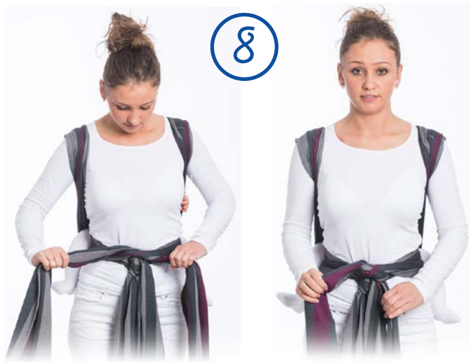
Zawiąż pasy ramienne na podwójny węzeł. Tie the straps. Use a double knot.