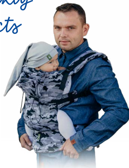
Nosidełka ergonomiczne Ergonomic carriers