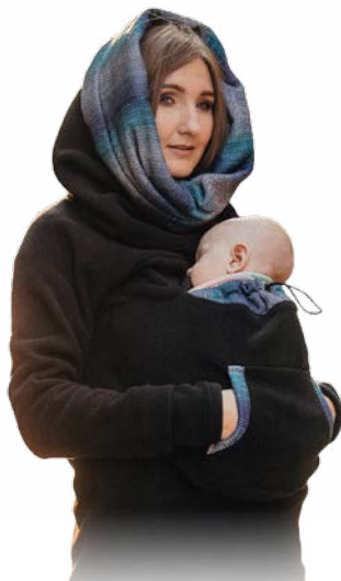
Odzież do noszenia dzieci Babywearing apparel