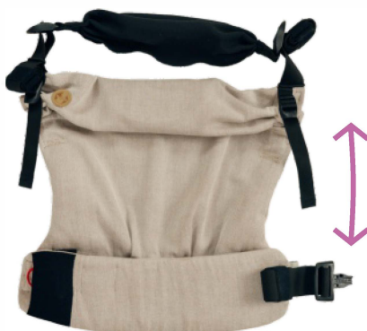
Regulacja wysokości panelu Adjustment of the height of the carrier's panel